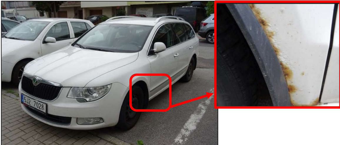
Foto 12 Pohled na korozí vozidla LP blatník