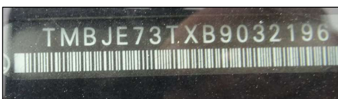
Foto 2 kontrolní foto VIN