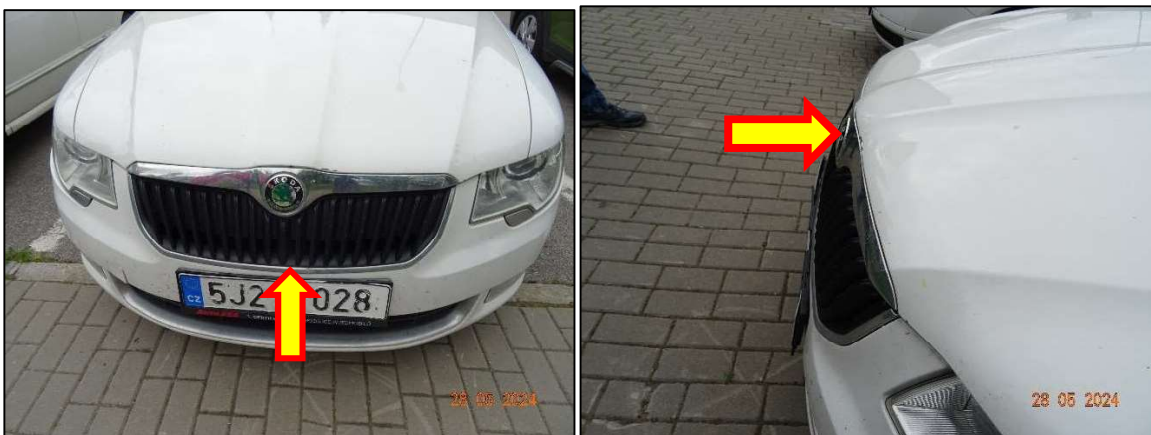
Foto 14,15 pohled na poškození od havárie vozidla na přední části