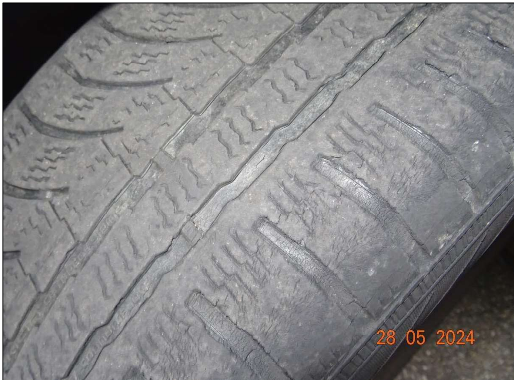
Foto 16 Pohled na LP pneumatiku 205/55 R16 94V XL Nokian