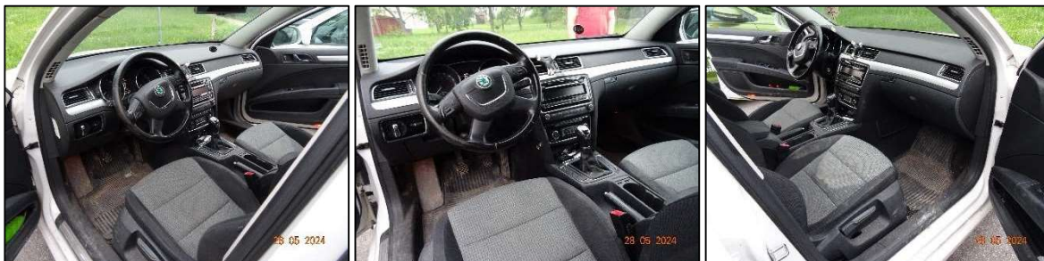
Foto 9-11 pohled na interiér vozidla