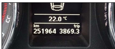
Foto 1 kontrolní foto tachometru