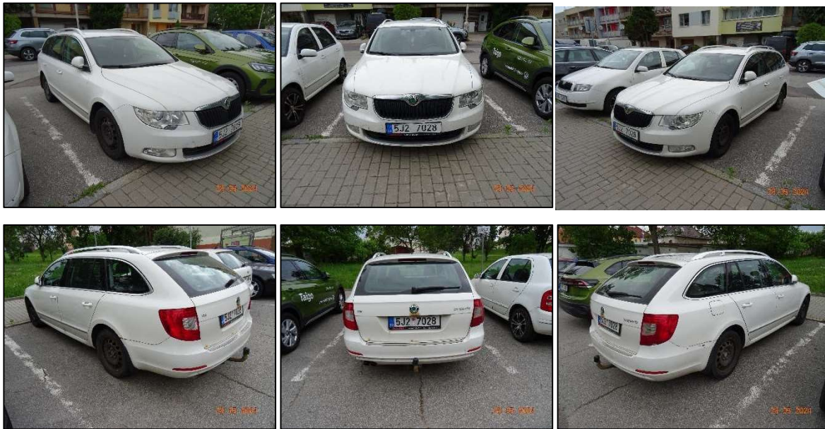
Foto 3 až 8 pohled na vozidlo Škoda Superb 2,0 TDi Combi

Technický stav jednotlivých skupin vozidla zjištěn při prohlídce vozidla dne 28.5.2024 níže podepsaným znalcem.