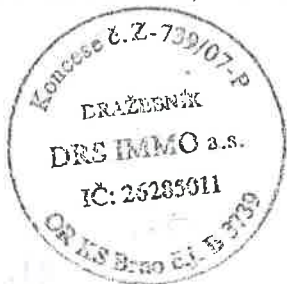
Ing. Alena Fiantová LL.M. za navrhovatele

Digitálně podepsal Ing. Alena Fiantová Datum: 2024.03.07 15:29:54 +01'00'