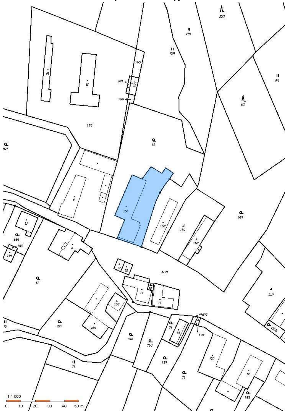
Pozemek p.č. st.10/1