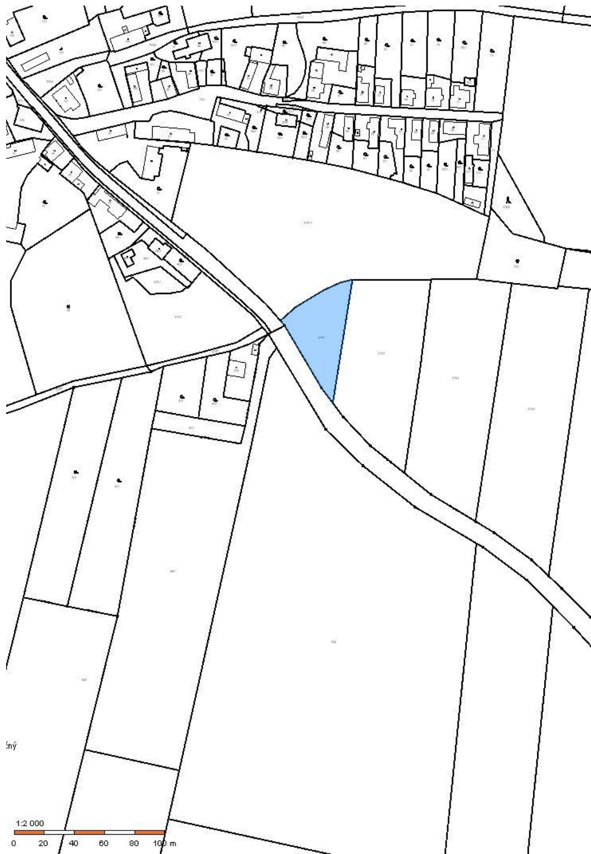
Pozemek p.č. 374/1 v k.ú. č. 761826